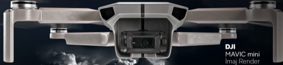
DJI MAVIC mini İmaj Render