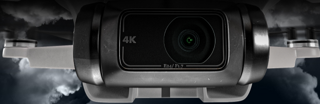
DJI MAVIC mini İmaj Render

“Ürün, sadece iyi olmakla yetinmez, doğru şekilde sunulmalıdır. ”